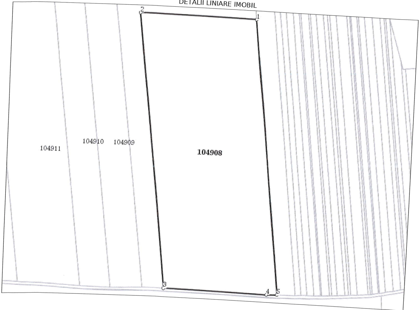
DETALII LINIARE IMOBIL

* Suprafața este determinată în planul de proiecție Stereo 70.